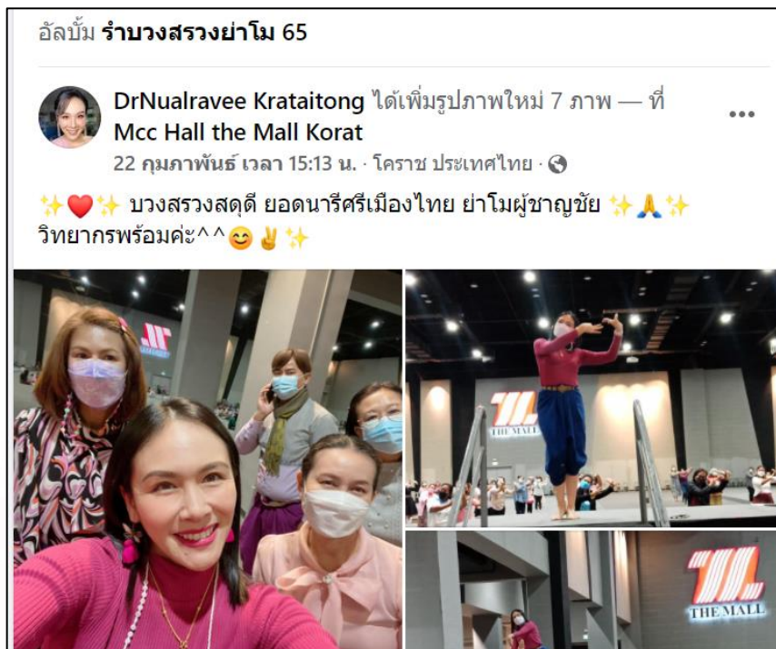
ภาพที่ 16 การโพสต์เฟซบุ๊กของคณะครูผู้ฝึกซ้อมรำบวงสรวงประจำปีพุทธศักราช 2565

นอกจากนั้นคณะครูและผู้ที่เป็นไปซ่อมรำบวงสรวงก็ยังโพสต์ภาพบรรยากาศการซ่อมรำกันเช่นเดิม ทั้งนี้เพื่อเป็นการปลุกพลังความรักและความสามัคคีเป็นพื้นที่ของสตรีจังหวัดนครราชสีมาได้ออกมารายรำเพื่อความเป็นสิริมงคลปีละครั้งโดยไม่เคยลดละเลิกความพยายามแต่อย่างใด ดังตัวอย่าง