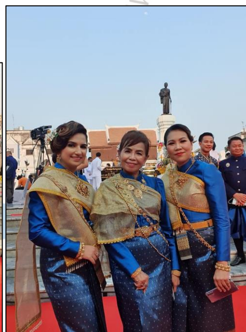
ภาพที่ 9 บรรยากาศการรำบวงสรวงท้าวสุรนารี ประจำปีพุทธศักราช 2564 (วันที่ 25 มีนาคม 2565)