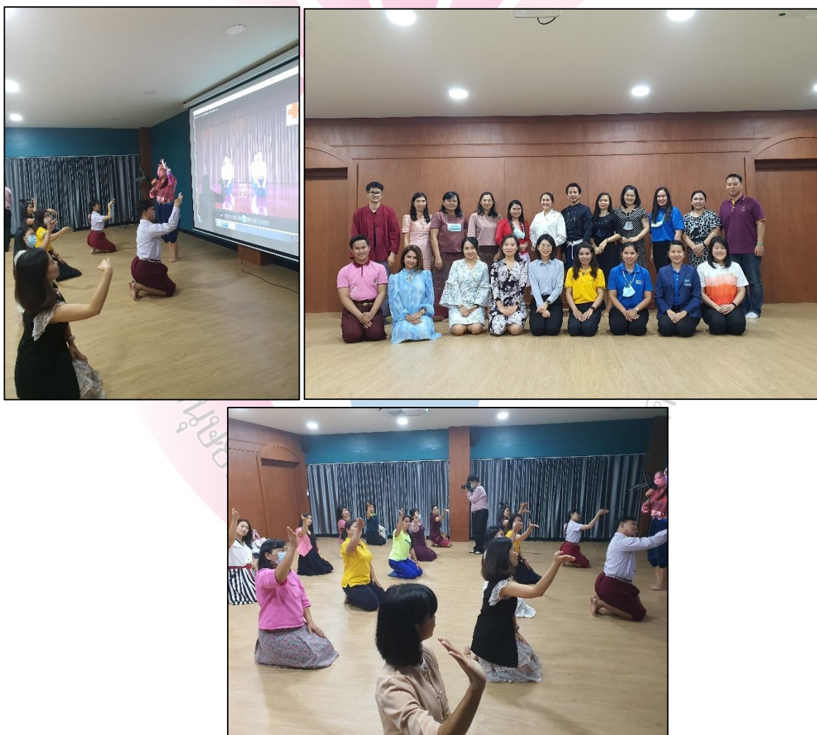
ภาพที่ 13 บรรยากาศซ้อมรำกลุ่มย่อยประจำปีพุทธศักราช 2564 ณ สำนักศิลปะและวัฒนธรรม มหาวิทยาลัยราชภัฏนครราชสีมา

ด้วยกันมา หากสมาชิกไม่ครบ เช่น ปีนั้นขอยกเลิกการรำด้วยเหตุผลส่วนตัวสมาชิกในกลุ่มก็จะทาบตามเพื่อนคนอื่นมาร่วมกลุ่ม และทำหน้าที่เป็นธุระบริการส่งผ้าและนัดวันฝึกซ้อมรำ สร้างความผูกพันกันในกลุ่มด้วยการสื่อสารผ่านโปรแกรมสนทนาไลน์หรือนัดหมายรับผ้าตามจุดนัดพบ หรือนฝึกซ้อมรำตามความสะดวกของสมาชิกแต่ละคน หากมีการซ้อมนอกรอบก็จะไปรวมกลุ่มกันเองตามสถานที่ต่าง ๆ เช่น สถานศึกษา หรือนัดให้ครูมาสอนซ้อมรำเป็นกรณีพิเศษ และโดยส่วนใหญ่จะฝึกซ้อมรำผ่านช่องทางยูทูบ