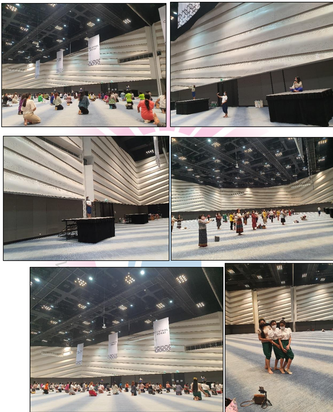
ภาพที่ 15 บรรยากาศซุ้มร้านค้า ศูนย์การค้าเซ็นทรัลพลาซ่านครราชสีมา และห้างสรรพสินค้าเทอร์มินอล 21 โคราช ประจำปีพุทธศักราช 2565