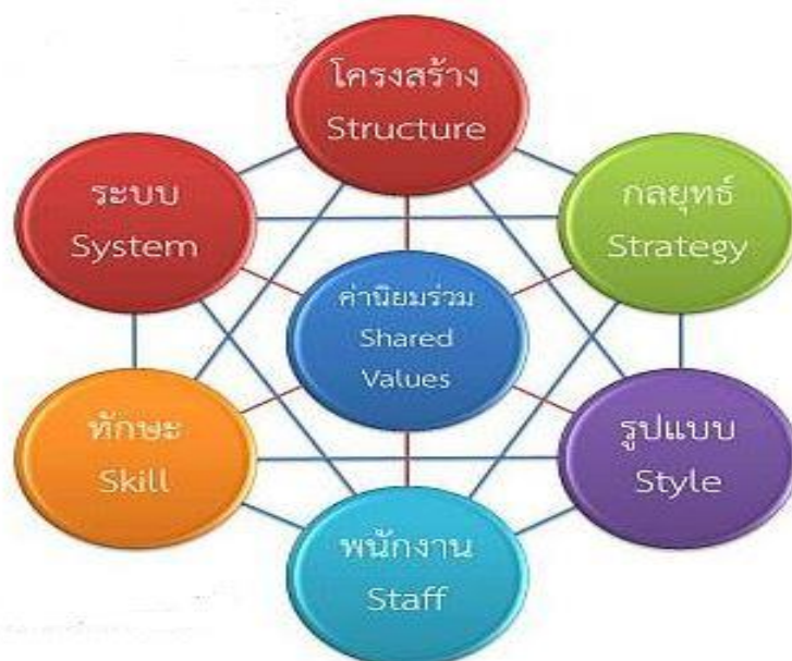
ภาพที่ 2.1 โครงสร้างพื้นฐาน 7-S (McKinsey 7-S Framework)

ศึกษาค้นคว้าโครงสร้างองค์การแบบใหม่คงจะไม่เกิดประโยชน์อะไรมากนัก เพราะรูปแบบโครงสร้างองค์การเป็นเพียงองค์ประกอบหนึ่งที่มีผลต่อความสำเร็จในการดำเนินงานของธุรกิจทางบริษัท แมคคินซีจึงได้เปลี่ยนแนวการค้นคว้าโดยการขยายการศึกษาค้นคว้าให้กว้างขวางยิ่งขึ้น ซึ่งผลการศึกษาพบว่าความสำเร็จในการดำเนินงานของกิจการธุรกิจต่าง ๆ หรือการบริหารงานที่สัมฤทธิ์ผลนั้นจะขึ้นอยู่กับตัวแปรที่มีความสัมพันธ์เกี่ยวเนื่องกันอย่างน้อยที่สุด 7 ตัวนอกจากเนื่องจากกลยุทธ์และโครงสร้าง เรียกว่า “โครงสร้างพื้นฐาน 7-S” (McKinsey 7-S Framework) ซึ่งกรอบแนวคิดนี้ต้องการนำเสนอว่าประสิทธิภาพขององค์การเกิดจากความสัมพันธ์ของปัจจัยต่าง ๆ 7 ประการขององค์การว่ามีลักษณะและมีสภาพอย่างไร โดยเป็นกรอบการพิจารณาและการวางแผนเพื่อกำหนดกลยุทธ์ในองค์การโดยการประสานองค์ประกอบทั้ง 7 ตัว ให้สอดคล้องประสานกัน ตัวแปรแต่ละตัวมีความสำคัญต่อการบริหารองค์การเริ่มตั้งแต่การกำหนดกลยุทธ์องค์การเกี่ยวข้องกับการพิจารณาโครงสร้างองค์การ เป้าหมายขององค์การ ระบบการดำเนินงานทักษะที่ใช้ในการทำงาน บุคลากร รูปแบบพฤติกรรมของพนักงานและเป้าหมายที่ต้องการ ซึ่งในระยะต่อมาได้รับการยอมรับและนำไปใช้อย่างกว้างขวาง และในปัจจุบันได้มีการนำมาใช้เป็นเครื่องมือในการวิเคราะห์องค์การในส่วน of SWOT ในด้านของปัจจัยภายในว่าองค์การนั้น ๆ มีจุดแข็งและจุดอ่อนในปัจจัยทั้ง 7 เป็นอย่างไร แผนภาพข้างล่างนี้เป็น Model ของ McKinney 7-S Framework ซึ่งจะเห็นถึงความเชื่อมโยงระหว่างปัจจัยต่าง ๆ ดังนี้ McKinsey (1980) อ้างใน เรวัตร์ ชาตรีวิศิษฐ์ (2554 :14)