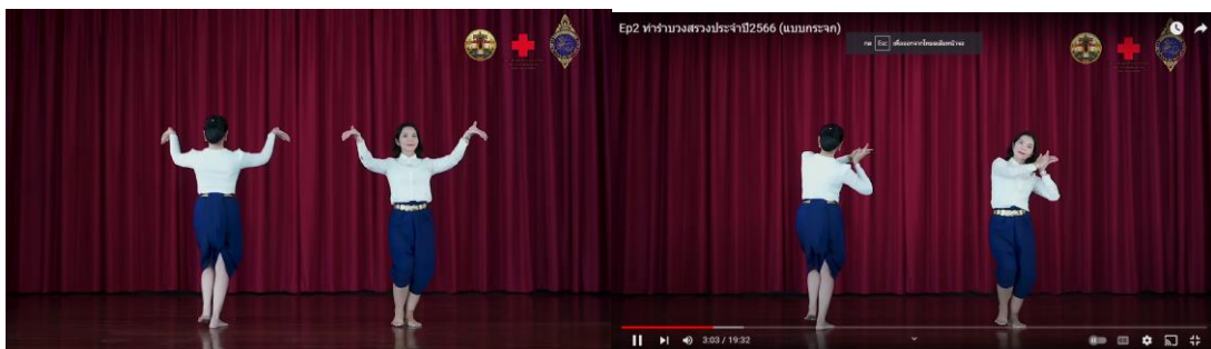
ภาพที่ 4.2 ท่ารำเพลงชองลมโชย (ทำนองมโหรีโคราช)

2. สัญญะผ่านรูปแบบการรำ (Dancing Format) การกำหนดท่ารำในบทเพลงนี้จะใช้ท่ารำที่สวยงาม และเชื่อมโยงอ่อนช้อย เพื่อแสดงความจงรักภักดีของชาวโคราชที่มีต่อสมเด็จพระนางเจ้าสุทิดา พัชรสุธาพิมลลักษณ พระบรมราชินี และสมเด็จพระเจ้าน้องนางเธอ เจ้าฟ้าจุฬาภรณวลัยลักษณ์ อัครราชกุมารี กรมพระศรีสวางควัฒน วรขัตติยราชนารี