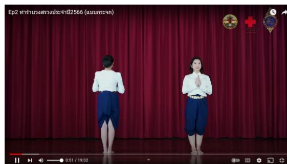
ภาพที่ 4.1 การไหว้ของนางรำช่วงบทนำของการรำบวงสรวงท้าวสุรนารี

พุทอังโหม อังมังโหม สั้งซังล้อม อัตรายาวินาศสันติ กราบคุณย่า ขอบารมี วีรสตรีของชาติ แม่อำนาจ เรืองรอง ผ่องใส สุ่มิ่งขวัญ เมืองโคราช ประกาศชัย ศูนย์รวมใจของทุกคน วิมลบุญ เหล่าสตรีรำบวงสรวงปวง ลูกหลาน ย่าปักบ้าน คุ่มครองเมือง นับเนื่องหนุน ขอคุณย่าประทานพร บวรคุณ อุดมบุญ ในทุกสิ่ง ยั่งยืนเทอญ