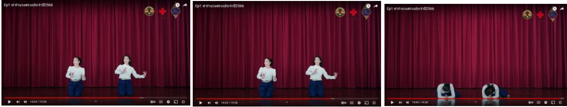
ภาพที่ 4.7 ท่ารำเพลง สดุดีวีรกรรมท้าวสุรนารี ทำนองสรภัญญะ (บทเก่า)

2. สัญญะผ่านรูปแบบการรำ (Dancing Format) ใช้ท่ารำเหมือนเดิม หากเป็นผู้ที่รำบวงสรวงประจำทุกปีก็สามารถรำได้อย่างคล่องแคล่ว เพื่อสร้างความสามัคคี ท่ารำสัมพันธ์กับเนื้อร้อง และท่ารำมีรายละเอียดค่อนข้างมาก มีทั้งทำนอง ยืนและกราบ ผู้รำต้องฝึกฝนมานานจนกระทั่งรำได้อย่างสวยงาม สะท้อนความศรัทธาที่มีต่อวีรสตรีมิเสื่อมคลาย