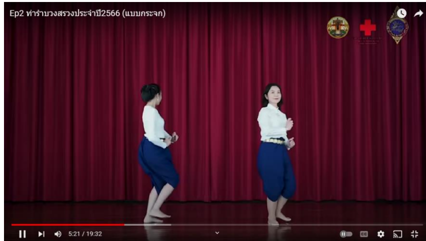
ภาพที่ 4.3 ทำรำเพลง 555 ปีราชสีมา (รำโทน 555 ปี เมืองโคราช)