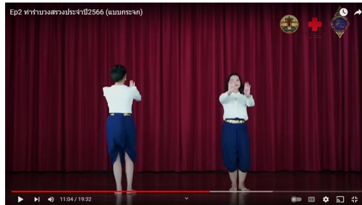
ภาพที่ 4.6 ท่ารำเพลงราชสีมาเมกะโปรเจก

2. สัญญาณผ่านรูปแบบการรำ (Dancing Format) รำด้วยรูปแบบง่าย ๆ ไปเรื่อย ๆ แต่ยังคงความสนุกสนาน และเน้นท่าที่สื่อสารสัมพันธ์กับเนื้อเพลง เมื่อเปลี่ยนท่อนเพลงก็เปลี่ยนท่ารำ สอดประสานได้อย่างดี