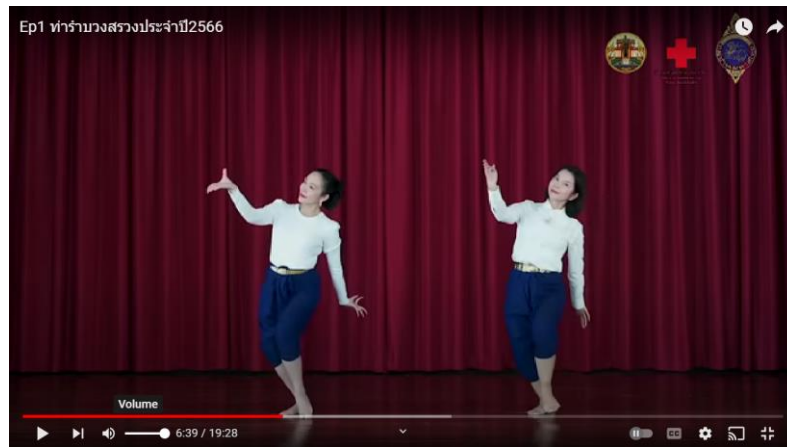
ภาพที่ 4.4 ท่ารำเพลงราชสีมาสง่าสวยสม

2. สัญลักษณ์ผ่านรูปแบบการรำ (Dancing Format) รูปแบบการรำต่อเนื่องจากเพลง 555 ปีราชสีมา (รำโทน 555 ปี เมืองโคราช) ที่เชื่อมโยงเนื้อหามาถึงจังหวัดนครราชสีมาคือแผ่นดินทอง ใช้ท่ารำที่จดจำง่าย ท่ารำสัมพันธ์กับเนื้อเพลง