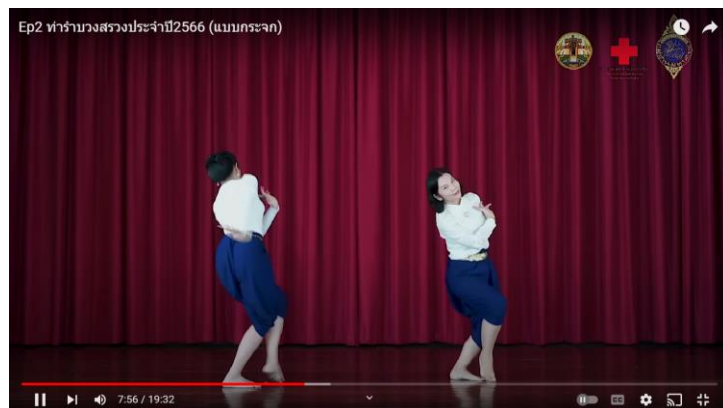
ภาพที่ 4.5 ทำรำเพลงโคราชไมตรีสัมพันธ์