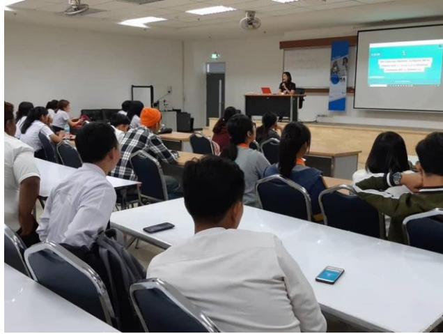
ภาพที่ 2 บรรยากาศการเรียนการสอนเพื่อเก็บข้อมูลวิจัยในชั้นเรียน