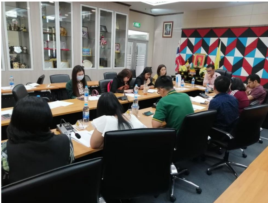
ภาพที่ 1 การประชุมเพื่อเตรียมความพร้อมสำหรับการถอดบทเรียนด้านการวิจัยในชั้นเรียน